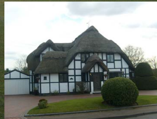
Jak se bydlelo