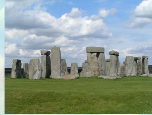
Co jsme navštívili