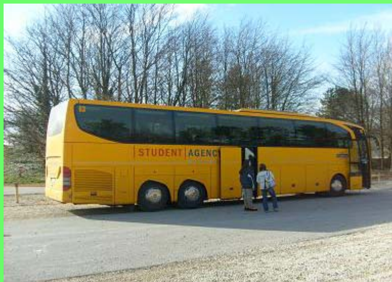
Náš žlutý autobus